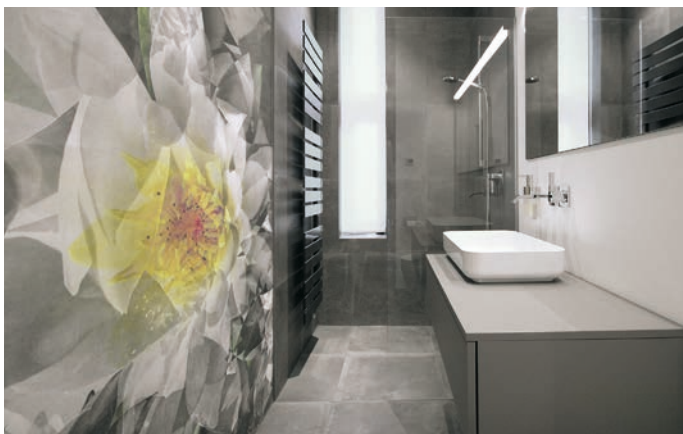
Grau-weiß-schwarz in matt (Fliesen, Tapete, Waschtisch) und glänzend (Waschbecken, Armaturen). Farbtupfer und Hingucker: die gelb-orange Blüte auf der Tapete (Goldmann Badmanufaktur, Berlin).