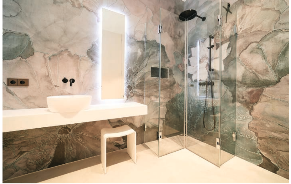
Tapeten mit floralem Lotusblütenmuster zu großen Flächen in Weiß (Waschtisch) und Sandfarbe (Bodenfliesen). Die Duschabtrennung in Rauchglas und schwarze Armaturen setzen Akzente (Bäderwerkstatt Ines Tanke, Apfelstädt).

Das Wohlbehagen in einem Raum hängt auch von den Materialien ab, die sich darin befinden. Was das angeht, ist das Bad ein besonderer Ort. Hier werden