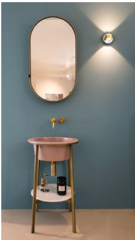
Waschtisch mit mattierter altrosa Keramikschüssel im Holzgestell über einer glänzenden Marmorplatte als Ablage. Blaugrauer Naturputz bildet den Kontrast, samtig schimmernde Kupferarmaturen schaffen die Verbindung. (R. Musculus GmbH, Bergisch Gladbach).

In Badezimmern ist Matt in. Das samtige Finish schafft zurückhaltende Eleganz und überlässt Hochglanz-Einzelstücken oder auch farbigen Flächen den großen Auftritt. Aber kurz mal der Reihe nach: Im Badezimmer ging es lange Zeit ziemlich glänzend zu – Keramik, Chrom und Spiegelflächen funkelten nur so um die Wette. Die so im Raum vorhandenen Spiegelungen lassen ihn optisch größer und durch das reflektierte Licht auch heller wirken. Inzwischen aber, begünstigt durch Trends, die von der Natur inspiriert waren, sind vermehrt auch matte Oberflächen und Armaturen in den Fokus gerückt. Dadurch eröffnen Hersteller von Sa-