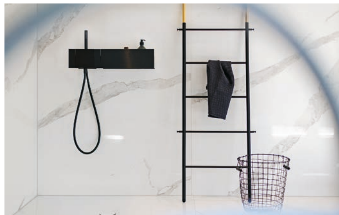
Mattschwarz auf glänzenden, großflächigen Fliesen in Marmoroptik: Duscharmatur mit Ablage, Handtuchleiter und geflochtener Metall-Wäschekorb (R. Musculus GmbH, Bergisch Gladbach).

der schlechten Belüftungs- oder Heizmöglichkeiten in Feuchträumen sind vorbei. Schichtverleimt und regelmäßig geölt, verträgt sich Holz selbst in der Dusche jahrelang mit Wasser. Für viele natürliche Materialien gilt jedoch, dass ihre