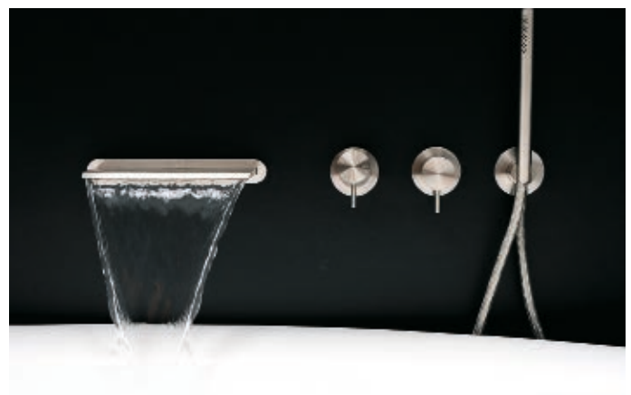
Matte Armaturen zu einem sachlichem Kontrast aus schwarzer (Vorwand) über weißer (Badewanne) Fläche (Bukoll GmbH Bäder und Wärme, Dießen/Ammersee).